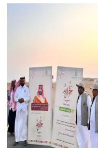
إفطار الصائمات ضمن مبادرة أجاويد 3