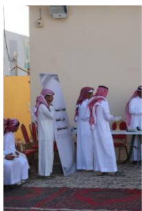
الاحتفال باليوم الوطني