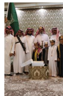
الاحتفال بيوم التأسيس